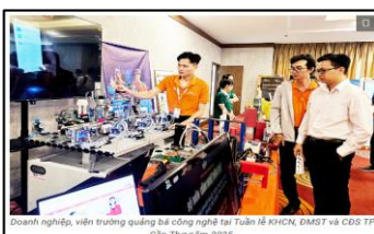
Doanh nghiệp, viện trường quảng bá công nghệ tại Tuần lễ KHCCN, DMST và CDS TP Cần Thơ năm 2025.