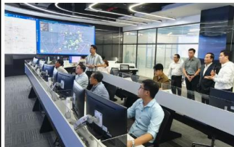
Bà Đur Thành Ý: TP.HCM triển khai Luật Quang Dân quyền Trưng cầu biểu bạch đồng minh tại Secosia

TPHCM yêu cầu các sở, ngành và địa phương triển khai khẩn trương, quyết liệt các nhiệm vụ, giải pháp nhằm thúc đẩy phát triển khoa học, công nghệ, đổi mới sáng tạo và chuyển đổi số, tạo động lực tăng trưởng mới.