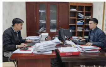
Chánh Văn phòng công chức chủ: Thanh tra tỉnh Hưng Yên ứng dụng công nghệ thông tin trong xử lý hồ sơ, văn bản, nâng cao hiệu quả quản lý, điều hành.

(Thanh tra) - Thực hiện Nghị quyết số 57-NQ/TW của Trung ương về đột phá phát triển khoa học, công nghệ, đổi mới sáng tạo và chuyển đổi số, Thanh tra tỉnh Hưng Yên đã chủ động triển khai đồng bộ các nhiệm vụ, giải pháp, đạt được những kết quả quan trọng trong năm 2025. Qua đó, từng bước khẳng định chuyển đổi số là yêu cầu tất yếu, là động lực góp phần xây dựng ngành Thanh tra ngày càng hiện đại, minh bạch, hiệu lực, hiệu quả.